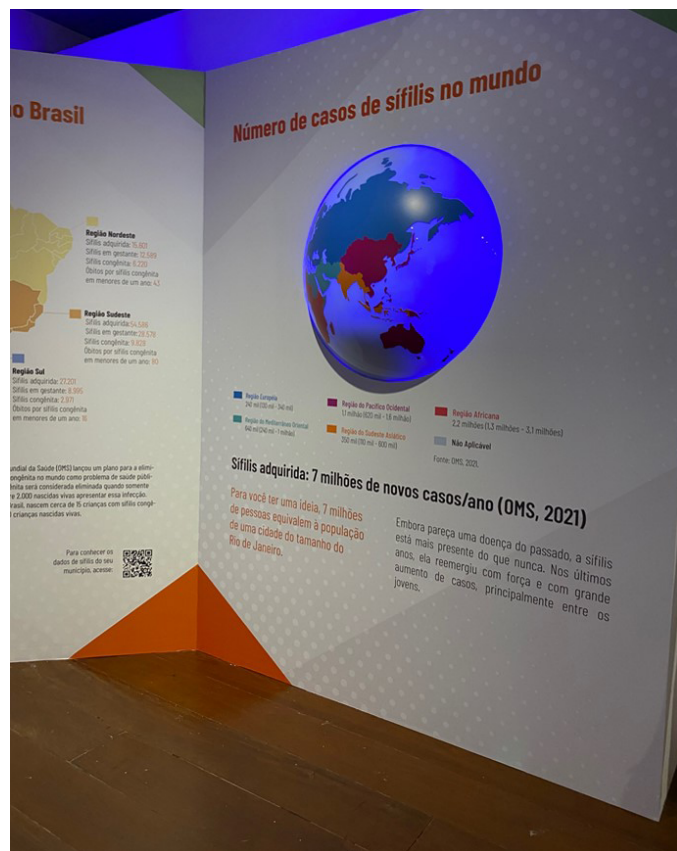
Figura 2. Panel con datos de sífilis en el mundo.