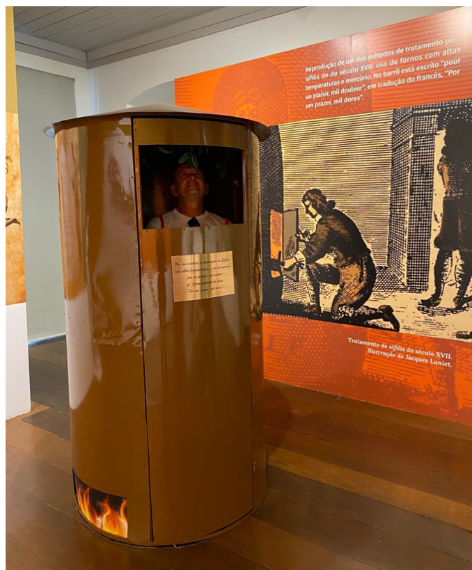
Figura 1. Horno usado en el Siglo XVII para tratamiento por calentamiento de los pacientes con sífilis.

Felicitaciones a todo el equipo que participa de este proyecto y creo que deberían aprovecharlo al máximo ya que detrás hubo mucho esfuerzo y compromiso.